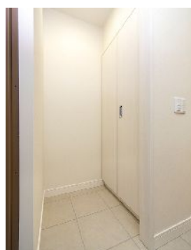
玄関横に設置された ベビーカー・ピット