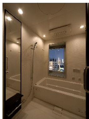
窓が設置された バスルーム