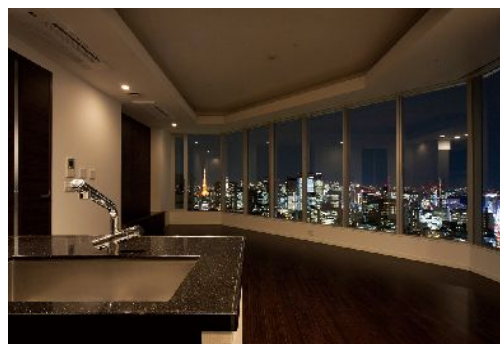
リビング・ダイニング・キッチン